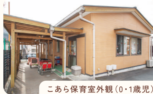
こあら保育室外観(0・1歳児)