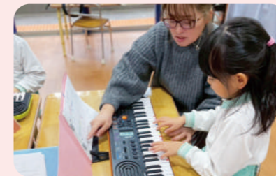
ピアノグループレッスン