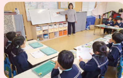
学研ブレイルーム