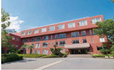
東京西キャンパス

自然と人間の共生をテーマに「いのち」を科学的な視点で探求する「いのちをまなぶキャンパス」で知識と技術を幅広く身に付け、深く学んでいきます。