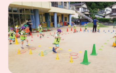
総合スポーツ教室